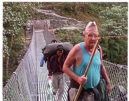
Prof. Jerzy Woyke w Nepalu w drodze na Anapurnę w celu obserwacji olbrzymiej pszczoły skalnej ( Apis laboriosa )

pszczoła po zabiegu. Badano wpływ różnych warunków i sposobów przechowywania matek przed i po sztucznym unasienieniu na efektywność inseminacji – tj. przeżywalność matek, zdolność opróżniania jajowodów, liczbę plemników w zbiorniczku nasiennym i koncentrację nasienia. Wyniki tych badań miały duże znaczenie praktyczne, szczególnie przy masowym unasienianiu matek pszczoł. Przez zastosowanie wypracowanych w tych badaniach metod, istotnie zwiększono efektywność sztucznego unasieniania. Wyniki badań nad doskonaleniem sztucznego unasieniania nadal często cytowane są w literaturze światowej i wykorzystywane w wielu krajach. Niewątpliwie zaliczyć je można do największych osiągnięć praktycznych. Określono