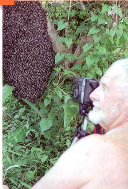
Obserwacje jednej z najbardziej niebezpiecznych pszczoł olbrzymich na Filipinach ( Apis dorsata brevilligula )

chorób i pasożytów; wykazanie, że periodyczne, wieczorowe loty trutni A. dorsata są wykonywane przez pszczoły zbieraczki; ● opisanie zachowań obronnych pszczoł Apis laboriosa w Nepalu, Apis dorsata w Indiach i Apis dorsata brevilligula na Filipinach.